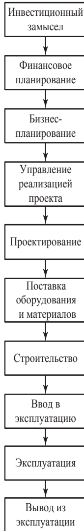
Рис. 2. Схема базового инвестиционно-строительного процесса [10]

На данном этапе разрабатывают предпроектную документацию (обоснование инвестиций, технико-экономическое обоснова-