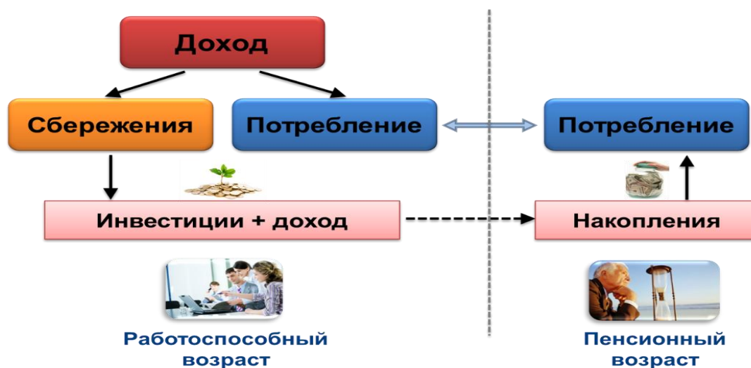
Рис. 1.1.6. Соотношение сбережения и потребления в зависимости от возраста

На начальном этапе норма сбережения должна быть высокой, чтобы обеспечить будущие потребности растущей семьи. Позже (когда семья разрастется) нередко наступает этап жизни «в кредит», когда семья вообще ничего не будет сберегать. После выплаты кредита норма сбережений постепенно увеличивается, поскольку доходы растут, а расходы почти не меняются. Когда дети оканчивают школу, норма сбережений может временно упасть, но потом снова вырастет и будет расти вплоть до выхода супругов на пенсию. После этого норма сбережения, естественно, станет отрицательной.